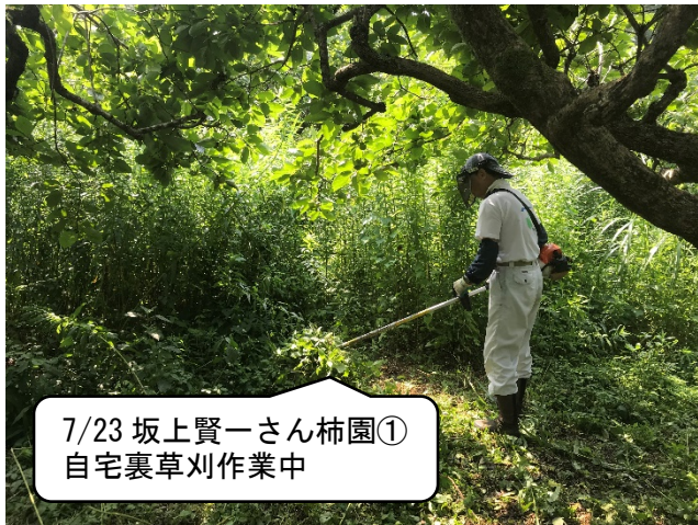
7/23 坂上賢一さん柿園① 自宅裏草刈作業中