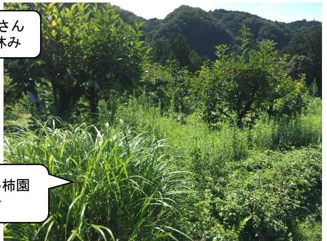
利子さん柿園 ビフォー