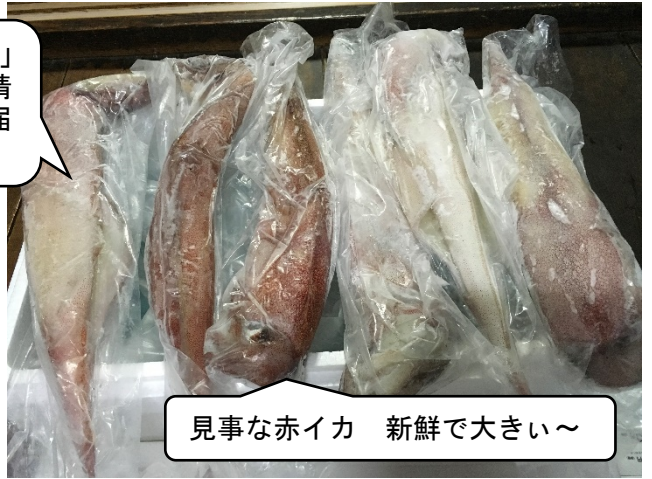
見事な赤イカ 新鮮で大きい～