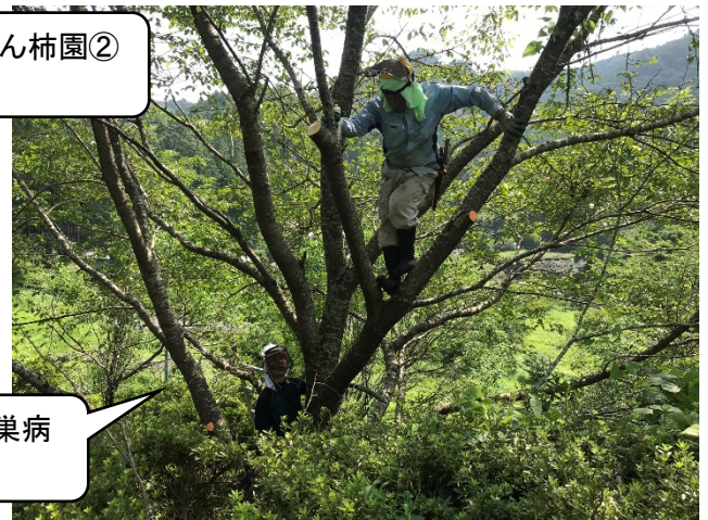
7/24 桜の天狗巣病 枝整理