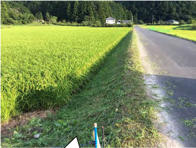
あぜ草を刈りました。