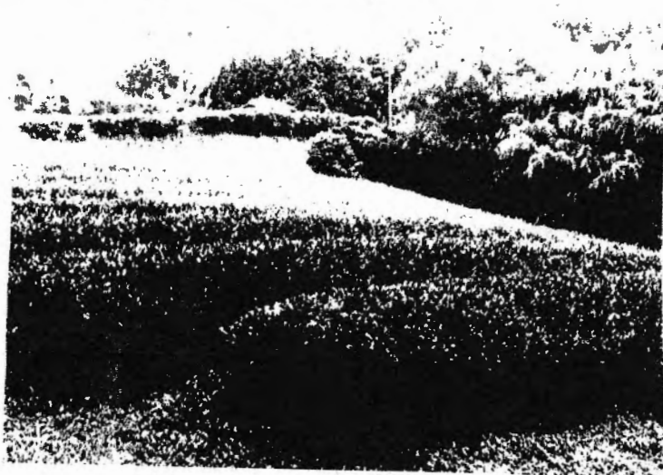
きれいになった茶園