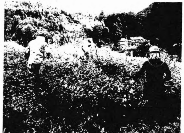
草をぬき、つるをとる