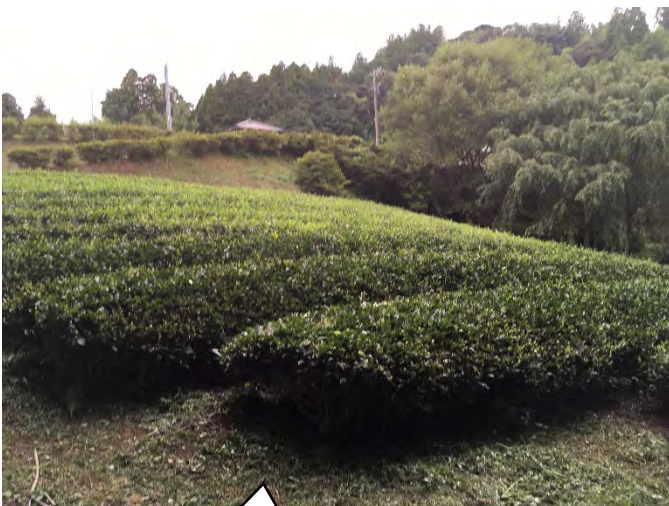
きれいになった茶園