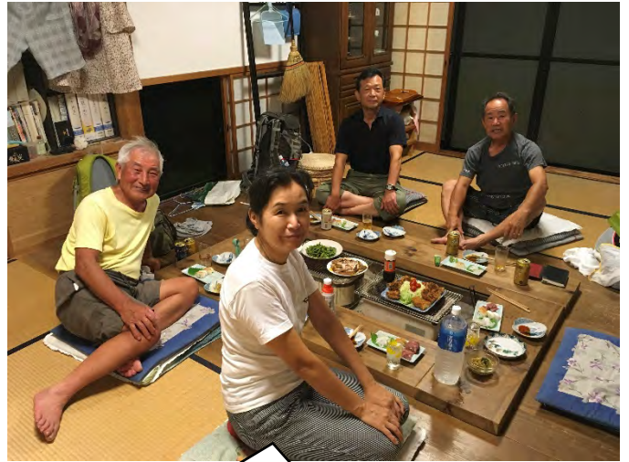
囲炉裏を囲んでの夕食