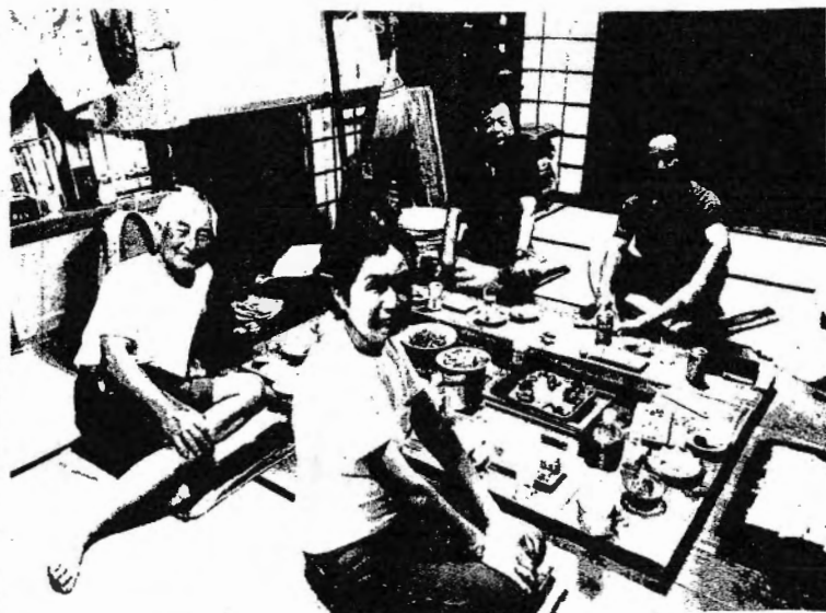
団が裏を団んでの夕食

8月9日(金)、まあ晴れ、少し暑い。久米さんかわり5人で東垂れ茶園の草取り。今年はハチの気配が無い。不気味だ。ネオニコ系農薬のせい(暑させい)。昼食は、サラダそうめん。続いて柵の邪魔な枝伐り。ツツジ園内や周辺の草刈り。これでお盆を迎えられる。