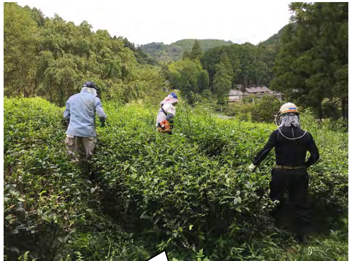
草をぬき、つるをとる